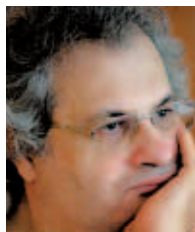
Amin Maalouf Orígenes / Orígenes

Traducción al castellano de María Teresa Gallego Urrutia y al catalán de Anna Casassas