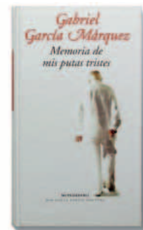
Memoria de mis putas tristes. Gabriel García Márquez. Editorial Mondadori.