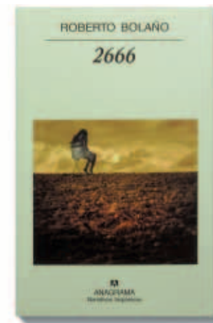
2666. Roberto Bolaño. Anagrama.