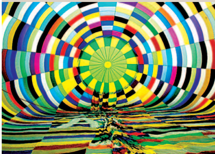
Los globos abundan en el territorio cultural catalán

La diferencia es que Gulliver era uno mientras que en nuestro territorio cultural abundan, hasta cierto punto, los globos, de distinto tamaño y colorido, cuyos tripulantes pugnan por deshacerse de tanta inútil cabullería y elevarse según su obra y talento. Ay, incluso en un número creciente de ocasiones, si observan que otro globo está en disposición de 'enlairar-se', abandonan el propio y corren en auxilio de la tropa de liliputienses que está a punto de impedirlo. La cuestión es que todos se queden en tierra. Algunos, además de participar en tan eficaces como contraproducentes maniobras, las justifican y teorizan en nombre de la posmodernidad y la igualación de criterios, valores y talentos que lleva aparejada. '¡ ca!' Es envidia rastrera, ancestral ánimo de mediocres asociados, que en su fervor arrastra a todos hacia su pobre y triste fin: "Antes in globos en el aire que con el mío en tierra, tanto si lo tengo como si creo que un día podría llegarlo a tener". Y si a alguno parece que se le ayuda, en simulacro de 'enlairament', es que tienen más agujeros que un colador y no hay cuidado de que llegue a cierta, ni que se esté mucho rato en ella. ¿Nombres? Porcel, Gimferrer, Monzó, y algún otro, cargan hoy con más lastre ajeno y malicioso que cinco años atrás