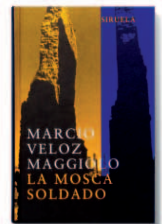
La mosca soldado. Marcio Veloz Maggiolo. Editorial Siruela.