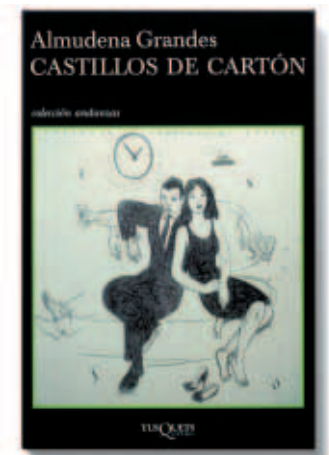
Castillos de Cartón. Almudena Grandes. Tusquets Editores.