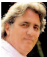
Abilio Estévez Inventario secreto de La Habana